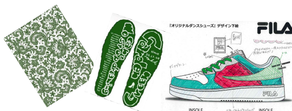
パフォーマンスに合わせ考えたデザイン画