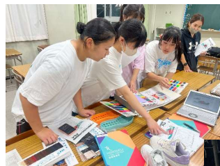
狛江高校ダンス部員の皆さんと、生地見本や、パーツ素材など選んでいきます。

チヨダブースでは、歴代のチヨダ賞オリジナルシューズや、ダンサーに嬉しい機能搭載のFILA TatticaDシリーズのシューズも展示。SNS投稿キャンペーンも実施しました。