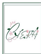
チームのロゴマークは、 シューズのパーツ部分 に印字されます。