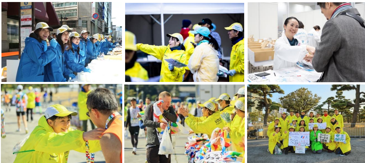
※東京マラソン 2024 での活動の様子です

東京マラソン財団オフィシャルボランティアクラブ「VOLUNTAINER（ボランティナー）」では、東京マラソン 2025 [2025年3月2日(日)開催] を一緒につくるボランティアを、9月3日(火)より募集します。東京マラソンで活躍されるボランティアはホスピタリティに溢れ、ランナーや大会運営を支える、東京マラソンを象徴するような存在です。「支える誇り」を胸に、大会を一緒に盛り上げてみませんか。ボランティア募集概要は、以下の通りです。