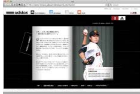
選手インタビューページ イメージ