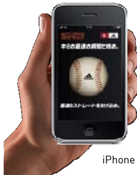
iPhone アプリ「デジタルトライアウト(投)」イメージ