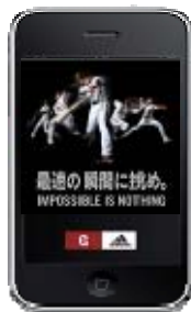
iPhone アプリ トップイメージ