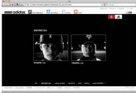
オリジナル Web フィルム イメージ