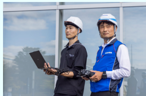
ドローンを操縦する自社従業員（右）