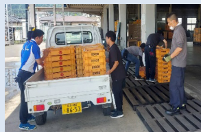
共選場での桃のケースの荷降ろし