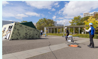
災害時を想定した屋外展示場で デモフライト