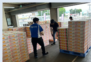
箱詰めされた商品の積み上げ