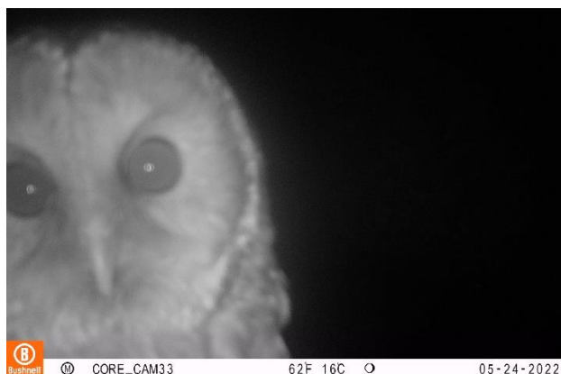
センサーカメラで撮影されたフクロウ