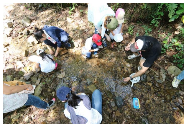
親子自然体験 小川で生き物さがし

SGホールディングスグループは、純粋持株会社SGホールディングス株式会社と、その傘下にある佐川急便株式会社をはじめとした事業会社で構成された総合物流企業グループです。