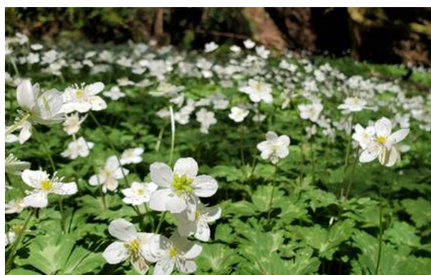
高尾 100 年の森に自生するニリンソウ