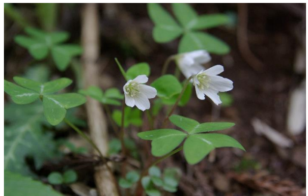
自生するカントウミヤマカタバミ(準絶滅危惧)

「自然共生サイト」の認定には「里地里山といった二次的な自然環境に特徴的な生態系が存する場」、「越冬、休息、繁殖、採餌、移動(渡り)など、動物の生活史にとって重要な場」であることが求められます。