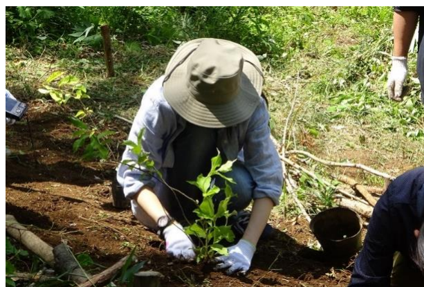
企業間連携による植樹体験の様子