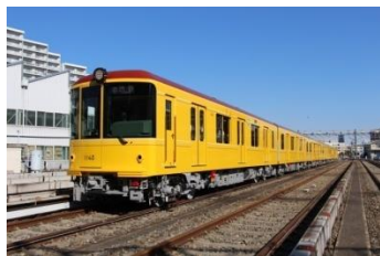
<銀座線1000系特別仕様車両>