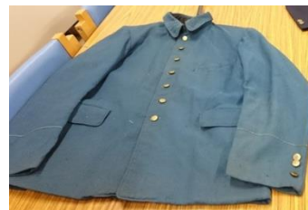
<復刻制服（イメージ）>