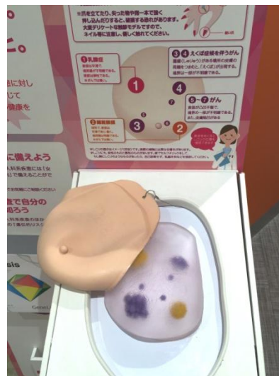
乳がん触診キット