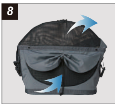
2箇所のメッシュウインドウ