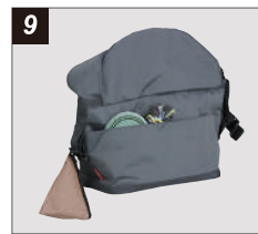
大型ポケット&固定ベルト