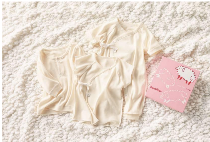
画像は「ピュアベビーウール」 長袖シャツ/打合せ半袖肌着/カバーオール型肌着

ファミリアはこれからも「あかちゃんとママに嬉しい」機能的な商品を展開して参ります。