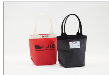
バケツトート(SS) 4,400円(税込)

SSサイズはお弁当入れやお子様用のバッグとしておすすめ。ペットボトルも入る大きさです。