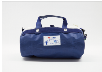
ダッフルバッグ(S) 19,800円(税込)

筒型ショルダーバッグ。正面ボーダー切替生地部分は二重になっていて、マジックテープ開閉式のポケットになっています。