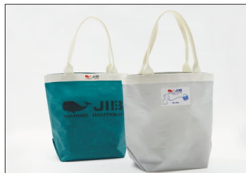
バケツトート(M) 5,500円(税込)

Mサイズはお買い物やアウトドアにおすすめです。持ち手は肩からかけてお使いいただけます。