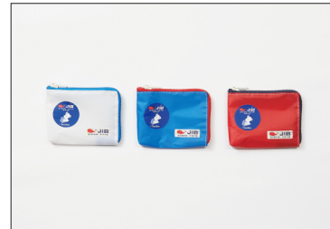
マイクロクラッチ 3,850円(税込)

仕切ポケットが付いているので、日々の買い物や出張経費のレシートなどを分別したい方におすすめ。色違いで用途を分けて使えます。