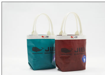
バケツトート(S) 4,950円(税込)