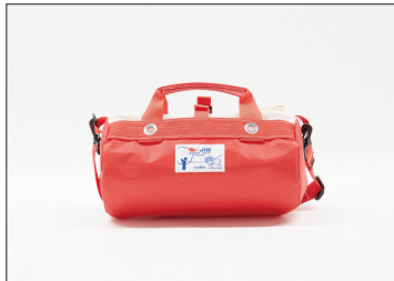
ダッフルバッグ(SS) 16,500円(税込)

筒型ショルダーバッグ。普段使いや日帰りの旅行など、あらゆるシーンでお使いいただけます。