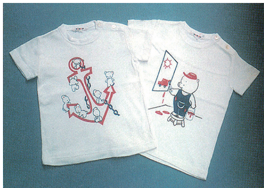
※開発当時のおはなしTシャツ