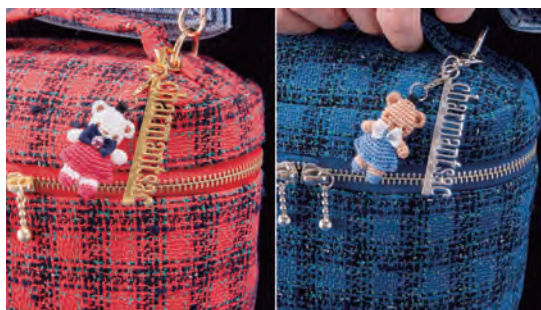
巾着バッグ・バニティバッグに付属のチャーム