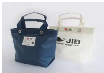
トートバッグM 11,000円(税込)

阪神間で長年愛され続けているバッグメーカー「JIB(ジブ)」とコラボレーションしたアイテムを店舗限定にて販売いたします。ヨットのセイルクロスを使ったJIBバッグは軽さ・丈夫さが特長です。ヨットの帆を縫うのと同じ裁断・縫製方法で作られているため、しっかりとした作りとなっています。専用のロープを使えば救助道具にも早変わり。防災アイテムとしても活躍するJIBバッグをイメージしたファミちゃんのワッペンも、コラボレーションならではのポイントです。