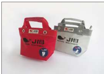
トートバッグS 8,800円(税込)

インナージップつきなのでお様が持たれても安心です。Mサイズとおそろいで親子バッグとしてもおすすめです。