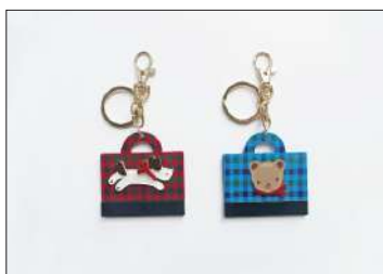
チャーム 各3,850円(税込)

アーカイブ柄のクマをモチーフにしたチャーム。大き目のサイズなので、バッグに着けたり、キーホルダーにいただけます。