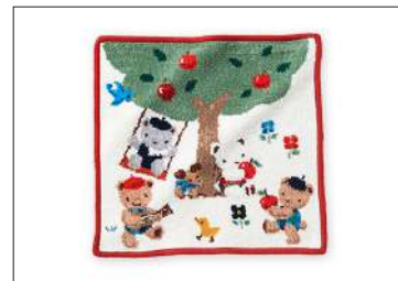
タオルハンカチ 2,530円(税込)

デニムバッグのモチーフでもお馴染みの、クマのアートを人気のシェニール織りタオルハンカチに落とし込みました。