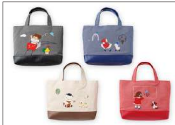
ミニバッグ 11,000円(税込)

定番のデニムバッグを、小さくリメイクしたミニバッグ。ブラック・ネイビー・レッドは、過去のデニムバッグからアートを抜き出したアーカイブ柄。※詳しくは詳細URLをご確認ください。