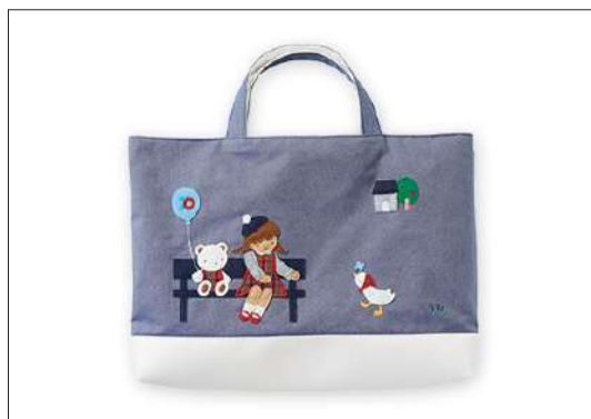
マチ付きデニムバッグ 16,500円(税込)

70周年を記念して、70thの刺繍を施したマチ付きデニムバッグ。女の子とクマがお揃いで、ファミリアチェックの洋服を着ています。また11月には、神戸本店限定デザインの販売も予定しています。