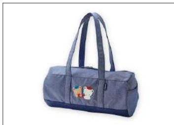
ドラムバッグ 13,200円(税込)

初登場のデニムのドラムバッグ。内ポケットを含め、9つのポケットつき。通園のサブバッグとしてもおすすめです。