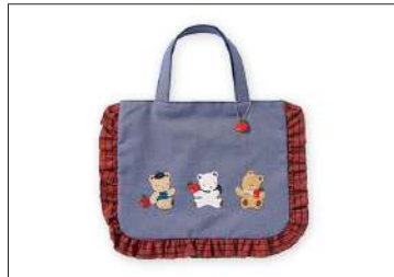
フリルバッグ 15,400円(税込)

ファミリアチェックのフリルが可愛い、バッグ。本体のアートに合わせた、リンゴのチャームがポイント。