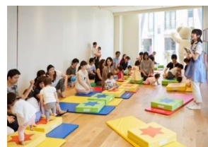
※画像はすべてイメージです

【読者、一般のお客様からのお問い合わせ】 株式会社ファミリア カスタマーサービスセンター 0120-078-345