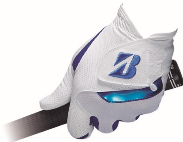
ULTRA GRIP COOL（GLGS31 WH）