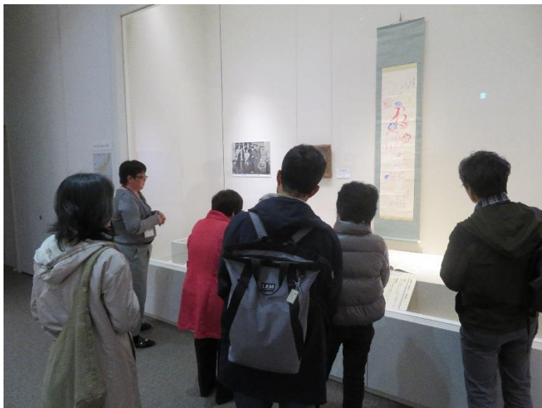
実際に解説している様子