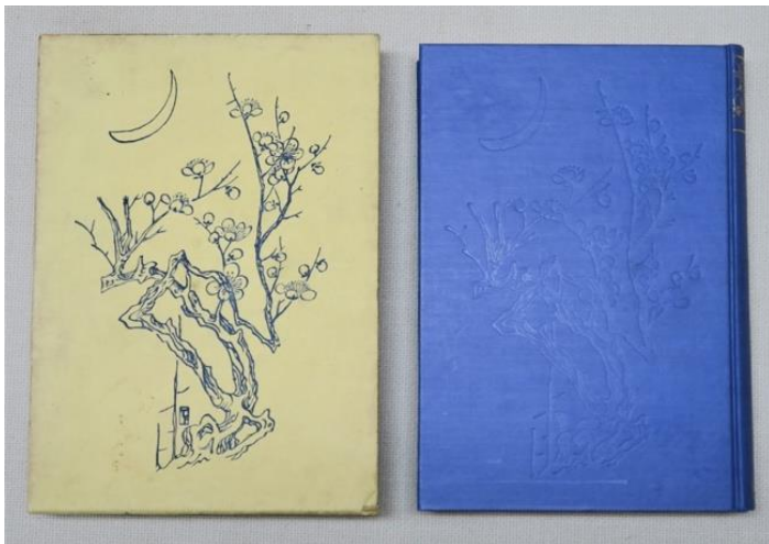
▲『与謝野寛短歌全集』(昭和8年(1933)、明治書院刊)

詳細 : https://www.sakai-rishonomori.com/exhibition/yosanotekkan/