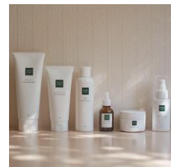
院内処方コスメ一式

ニキビ治療 学生割引コース（平日限定） 39,500円（税込） ※通常65,950円（税込）