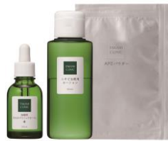
オリジナル治療薬（約1ヵ月分）