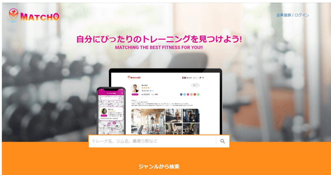
【画像：ウェブサイトのトップページの抜粋】

MATCHOは、17の 카테고리 *2 に従事している団体（ジムやスポーツクラブ、教室など）および個人（フリーランスのトレーナー、インストラクター、ダンサーなどや団体に所属しているトレーナー、インストラクター、ダンサーなど）を対象に掲載しており、趣味から健康、習い事、トレーニング、大会などユーザーの生活圏で幅広い目的に合わせたサービスを見つけることが可能です。サービスの提供者であれば誰でも無料