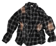
Old Check Shirt