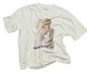
Strange Print Tee