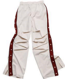
Form Track Pants