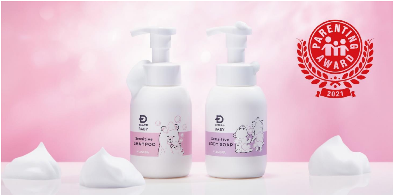
左:スカルプD ベビー センシティブシャンプー 右:スカルプD ベビー センシティブボディソープ

アンファー株式会社(本社:東京都千代田区、代表取締役社長:叶屋宏一 以下「アンファー」)のスカルプD ベビー センシティブシャンプー及びボディソープが2021年11月25日(木)に人気育児雑誌が選ぶ今年の子育てトレンド「第14回ペアレンティングアワード2021 モノ部門」を受賞いたしました。スカルプD ベビー センシティブシャンプーとボディソープは、赤ちゃんの肌は頭皮や顔、からだなど部位によって特徴が異なる点に着目し誕生しました。デリケートな赤ちゃんの肌のためのシャンプーとボディソープです。