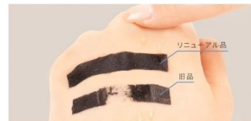
※人工汗液を3回塗布し、擦った状態で比較

3回水をかけてこすっても落ちにくく※3どんなシーンでも心強い、水・汗・涙に強いウォータープルーフタイプ。また、簡単にこすらず落とせるお湯落ちタイプで、メイクオフの時までまつ毛・目元への負担がなくなるようこだわりぬいた設計です。