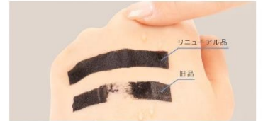
※人工汗液を3回塗布し、擦った状態で比較

3回水をかけてこすっても落ちにくく ※5 どんなシーンでも心強い、水・汗・涙に強いウォータープルーフタイプ。また、簡単にこすらず落とせるお湯落ちタイプで、メイクオフの時までまつ毛・目元への負担がなくなるようこだわりぬいた設計です。