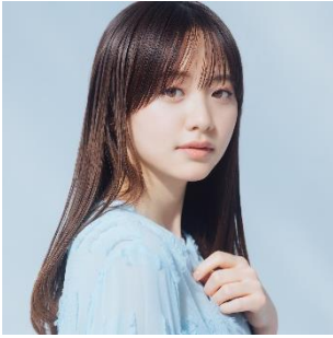
森 香澄(もり かすみ)

2019年にテレビ東京・アナウンス部に入社。『THEカラオケ★バトル』や『ウイニング競馬』、『よじごじDays』などの司会を務め、その明るく親しみやすいキャラクター、柔らかな雰囲気で大人気に。2023年3月31日にテレビ東京を退社し、プロダクション「seju」に所属。さまざまな人気バラエティ番組に出演し、俳優としても連続ドラマに出演するなど、アナウンス業のみならず多岐に渡り積極的に活動を広げている。