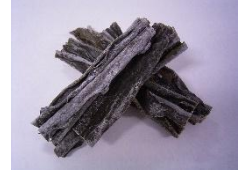
ミツイシコンブエキス ※4

「何気なくこすった瞬間…」といった経験はありませんか。今回のリニューアルでは、伸びたまつ毛をしっかりキープし、美しいまつ毛を維持してくれる「WIDELASH TM 」 5 に加え「ミツイシコンブエキス ※4 」を新たに配合。プレミアムだけの「キープ成分 ※3 」が、まつ毛の土台をしっかり整え、より健康で抜け目ない ※1 まつ毛に導きます。