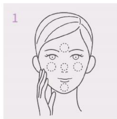
1 顔5か所（額・鼻・頬・両頬）にクリームをつけます。いきます。