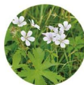
ゲンノショウコエキス