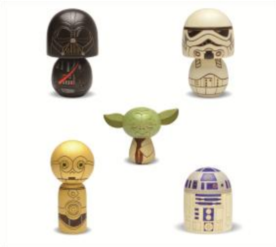
こけし／5,400円（5種/先行発売） スター・ウォーズのキャラクターが日本の伝統文化と出会って、味わいのあるこけしになりました。