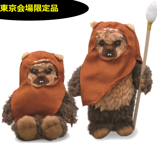
1/4 座りウイケット・1/4 サイズウイケット/3,240 円 イウォーク族の代表「ウイケット」の等身大 1/4 サイズのぬいぐるみ。 各バージョン 1000 個限定です。