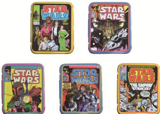
ミント缶/540 円 (5 種/先行発売) レトロなコミックアートがプリントされたミントタブレットです。 アフターユースもできます。