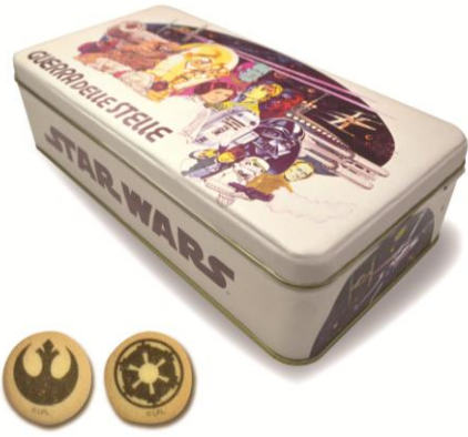
クッキー缶／1,080円（1種） レトロな缶のなかには、帝国軍と反乱軍のシンボルがプリントされたクッキーが入っています。