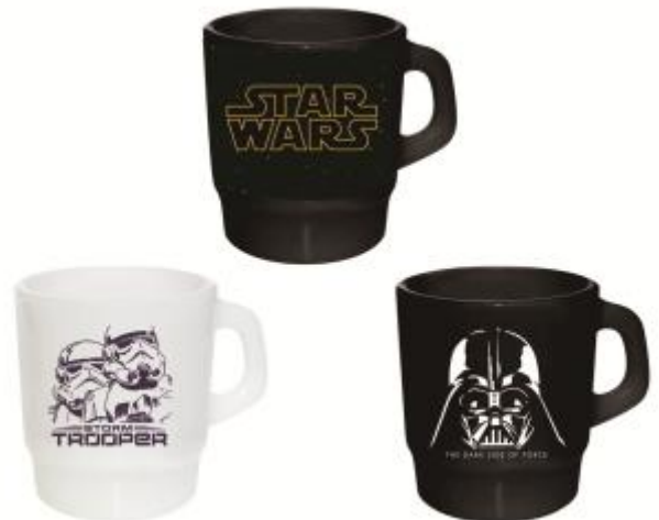
ファイヤーキング/5,000 円 (3 種) アメリカンヴィンテージを象徴するファイヤーキング。スター・ウォーズデザインが数量限定で登場です。