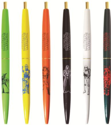
BIC ボールペン／400円（8種） 高級感のあるゴールドのクリップとリングがクラシックなボールペンです。お気に入りの1本を見つけてください。

【その他のラインナップ】 スター・ウォーズのキャラクター達をモチーフにした粋な手ぬぐい（1,404円）や、数量限定の TEMBEA のトートバッグ（17,280円）など取り揃えています。