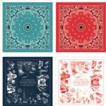
バンドナ/1,080 円 (4 種/先行発売) ハンカチとしても使える大判のバンドナ。これからの時季に大活躍です。