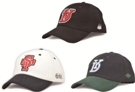
キャップ/2,160 円 (3 種) イニシャルワッペンがおしゃれなキャップです。後ろの刺繍がポイント。