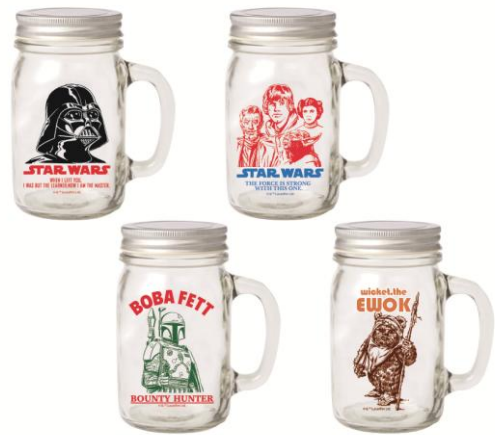
ドリンクジャー/1,728 円 (4 種) ヴィンテージ風な絵柄が素敵なドリンクジャー。使い方のバリエーションはさまざまです。