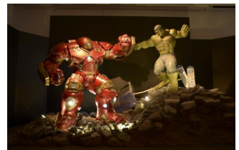
ホットトイズ社製の実物大フィギュア「ハルク vs ハルクバスター」 ※画像はイメージです。

ホットトイズ社製の実物大フィギュア「ハルク vs ハルクバスター」。まるで映画の中に迷い込んだかのような、壮大なマーベルの世界観を感じることができます（4月27日（木）まで限定）。また、六本木ヒルズ内9か所にフотスポットも出現。さらに、ウエストウオーク4階にはブルックリンの街をイメージした「マーベルのストリートギャラリー」も登場。六本木ヒルズの街全体がマーベル色に染まる、未だかつてない一大プロジェクトにご期待ください。