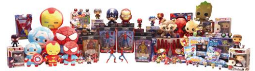
「MARVEL 六本木ヒルズ ホットトイズストア」商品例