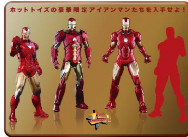
「MARVEL 六本木ヒルズ ホットトイズストア」限定 アイアンマン フィギュア各種