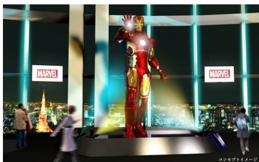
エントランス：5mのアイアンマン (コンセプトイメージ)