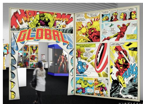
コミックスをイメージしたゲート (コンセプトイメージ)