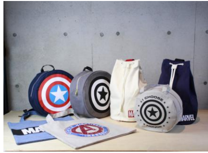
「マーベル展公式ショップ」商品例 © 2017 MARVEL