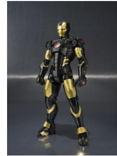
「マーベル展公式ショップ」商品例 © 2017 MARVEL