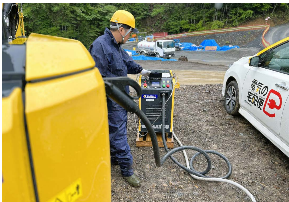
【MESTA Gen（右）と充電器（中央）を用いて電動ミニショベル PC30E-6（左）に充電をしている様子】

*1 : - GX 建機の現場運用拡大に向けたゼロエミッション給電ソリューションの推進 - ベルエナジーとコマツ、移動式給電車「MESTA Gen」により バッテリー式電動油圧ショベル 6 機種への給電を実証 | ニュースルーム | コマツ 企業サイト