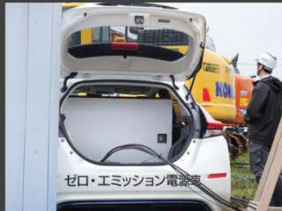
工事現場・仮設電源