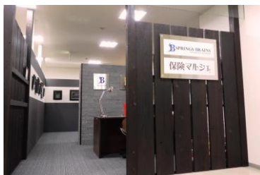
落ち着いた雰囲気のお店