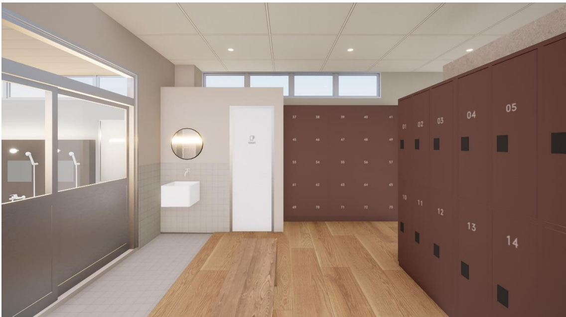
すっきりと使いやすい脱衣所