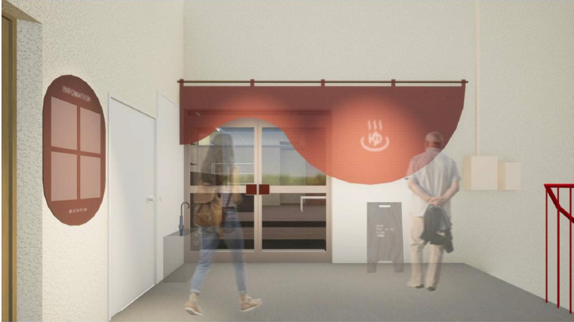
銭湯入口。明るい雰囲気ですべて入りやすいイメージを演出