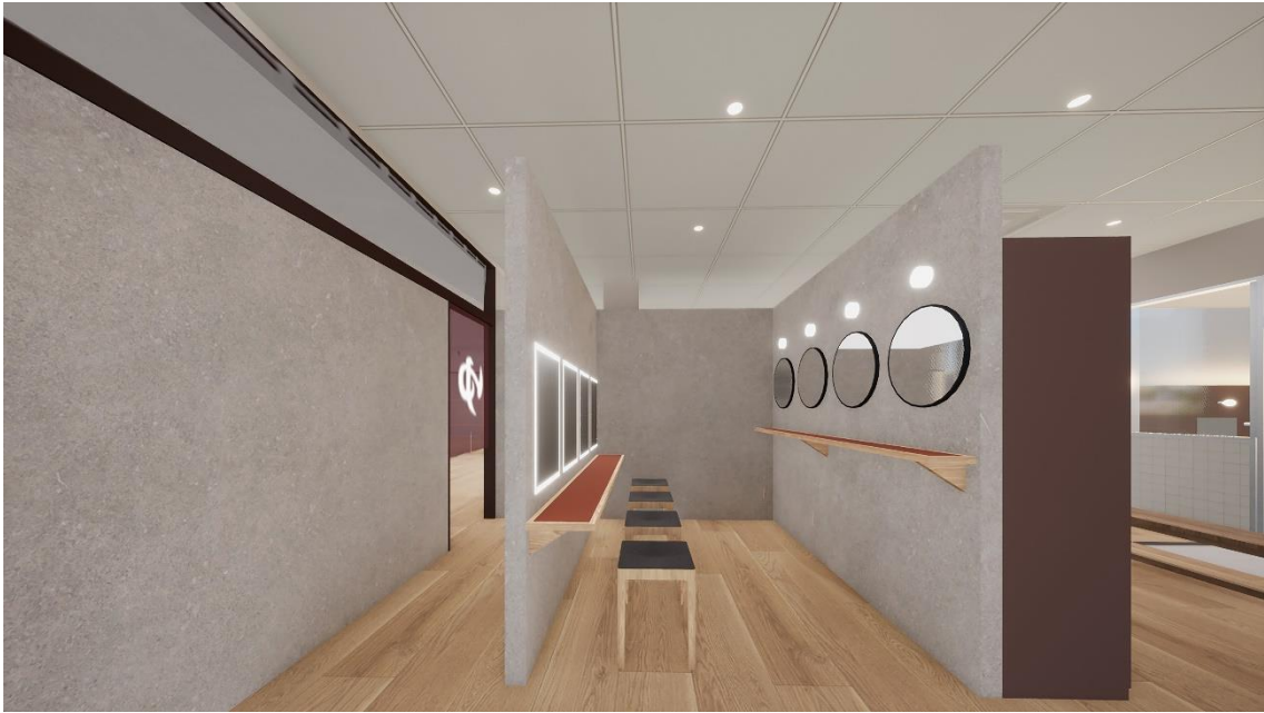
ゆっくりセルフケアができる新設の化粧コーナー