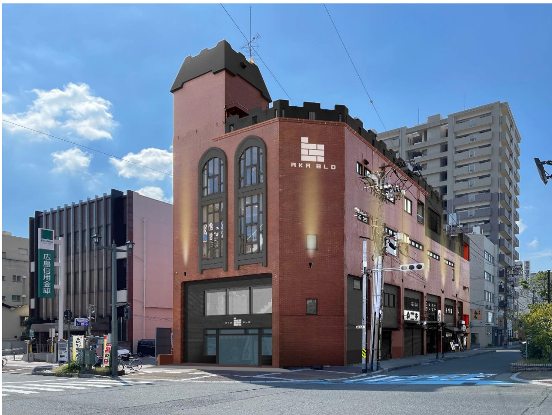
赤ビル外観リフォーム後。港町の赤レンガビンテージビルをイメージ