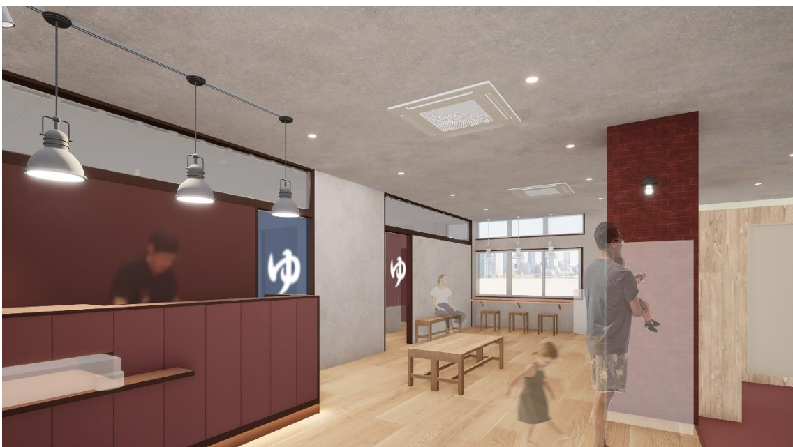
受付&休憩室。サロンのような落ち着いた空間を意識