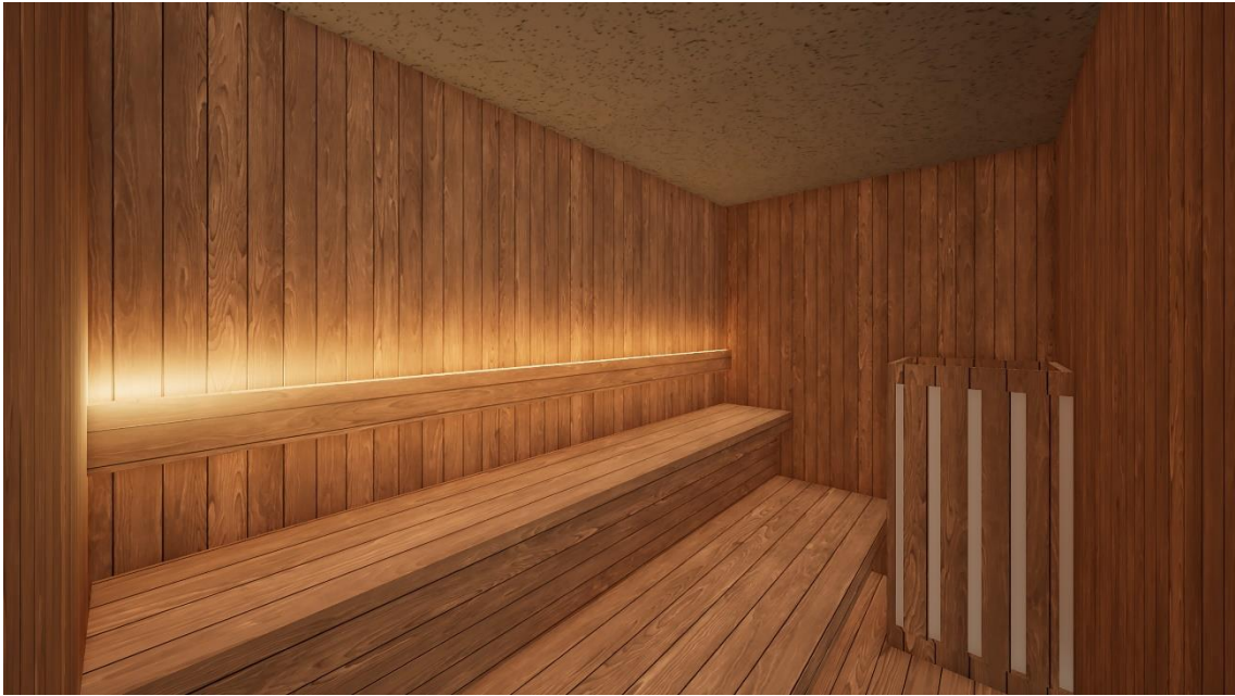
リニューアル後のドライサウナ。国産ヒノキを採用