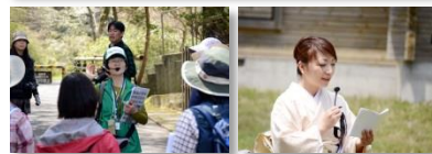
～昨年の第一回開校記念授業の模様～ 今年も桜の下でヨガやお茶会を実施します

開催日 2015年4月26日(日) 時間 10:00集合 13:30解散予定 教室(場所) ザ・プリンス 箱根芦ノ湖 別館ロビー前集合 (九頭龍の森で解散) ※雨天の場合は芦ノ湖キャンプ村多目的ホールにて実施いたします。 参加費 はこじょ学生: 3,800円(税込) / 一般: 4,800円(税込) はこじょ特製養生スープ&お抹茶和菓子付き 参加方法 はこじょWEBサイト、または事前電話予約の上現地参加も可 ※参加申込及び学生登録はWEBサイト ( www.hakojo.com ) 定員 30名 主催 一般社団法人はこねのもりコンソーシアムジャパン 後援協力 箱根町/富士フィルム株式会社/箱根ジオパーク推進協議会/ ザ・プリンス 箱根芦ノ湖/箱根園/環境省箱根ビジターセンター/ 箱根町観光協会/芦ノ湖キャンプ村/昭和女子大学/ 函嶺白百合学園中学・高等学校/足柄みなもと農園