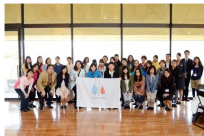
「はこじょ創造プロジェクト2014」発表の模様 1/4

はこじょでは2013年より、昭和女子大学の学生と協同で箱根の新たな魅力づくりのための「はこじょ創造プロジェクト」を実施しています。4月26日当日は、箱根町関係者及び報道関係者へ向けて「はこじょ創造プロジェクト 2015」の発表の他、YouTubeを活用した函嶺白百合学園中学・高等学校との共同プロジェクトの発表を行います。(詳しくは3ページをご覧ください)