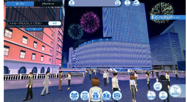
アバター操作画面のイメージ

大阪・梅田にある阪神百貨店と阪急百貨店前のエリアをバーチャル空間に3Dで再現し、ステージゾーンと2つのブースゾーンを構築します。ステージゾーンでは出演者の音楽ライブを視聴することができ、ブースゾーンでは各種イベントやグッズの購入等をお楽しみいただけます。バーチャル空間のため、普段は立ち入ることができない交差点内を実際に歩いているような臨場感を体感することができる上、インターネット環境があれば、どこからでもご参加いただけます。