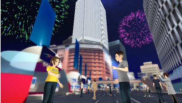
来場者アバター視線のイメージ

覚で簡単に操作することができ、会場内を自由に歩き回っていただけます。また、映像の配信やミニイベント、グッズの購入等をお楽しみいただけるブースも設置しており、コンサート以外にも様々なコンテンツをご用意しています。