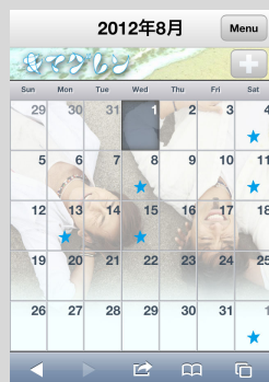
<キマグレスケジュール>