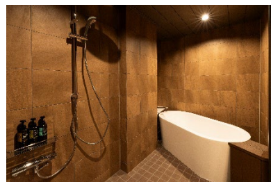
201 号室「花緑青」(はなろくしょう)《和モダンフラット和洋室 バス付客室》18.5 畳