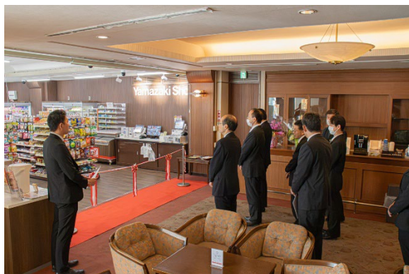
グランドオープン式典

※ホテルサンルート栃木は関東圏を中心に 21 施設の宿泊施設を運営する株式会社フォレスト(所在地：神奈川県足柄下郡湯河原町城堀 代表：石田浩二)のグループ施設です