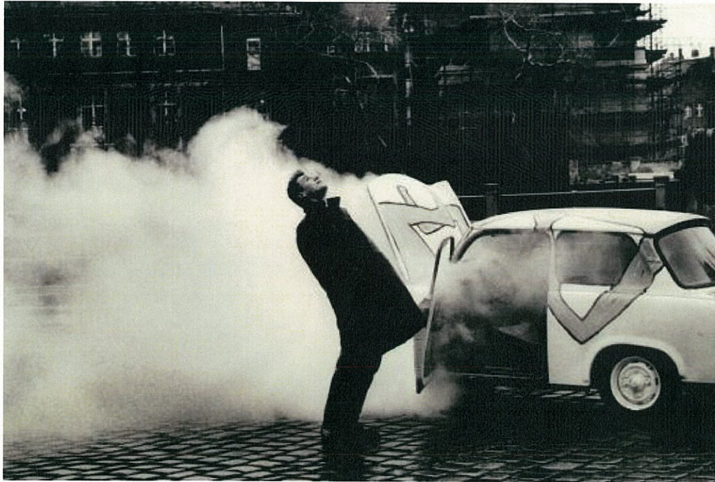
U2 フロム・ザ・スカイ・ダウン

世界を魅了した名作『アクトン・ベイビー』誕生から20年 傑作ドキュメンタリー映画を始めとする「U2スペシャル」で、世界のトップに君臨し続けるU2の魅力を再確認！