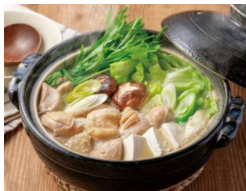
鶏とキャベツの発酵美人鍋