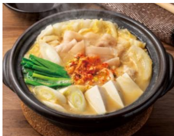
発酵美人キムチ鍋