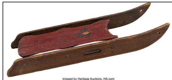
『市民ケーン』の「ローズバッド」のそり

2025年7月には、映画史を象徴する小道具の一つである『市民ケーン』の「ローズバッド」のそりがオークションに出品され、 1,475万ドル（約22億1,000万円）で落札 されました。この落札結果は、 映画関連メモラビアとしてオークション落札最高価格帯 となり、エンターテインメント部門におけるヘリテージ・オークションズの存在感を改めて示す出来事となりました。