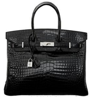
ダイヤモンドを施した エルメス・ボロサス・クロコダイルのバーキン