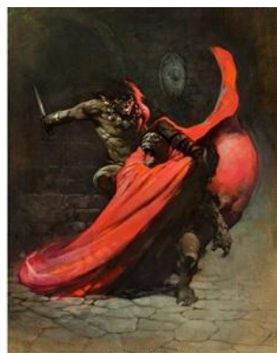
フランク・フラゼッタ 『コナン』小説表紙原画

これらの成果により、 コミック＆コミックアート部門は総売上約 2 億 1,620 万ドル （約 324 億円）を達成し、 部門史上 2 番目の年間実績を記録 しました。