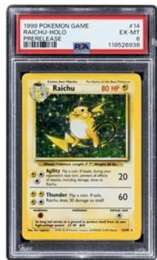
PSA により鑑定された世界唯一のポケモン 「ベースセット プレリリース ライチュウ」カード

トレーディングカードゲーム（TCG）部門でも記録的な成果が続き、12 月のオークションは 総売上 528 万ドル（約 8 億 3,240 万円） と、 TCG オークション史上最高額を記録 しました。中でも、 PSA により鑑定された世界唯一のポケモン「ベースセット プレリリース ライチュウ」カードは、55 万ドル（約 8,660 万円）で落札され、英語版ポケモンカードとして、世界最高額の記録を達成 しました。