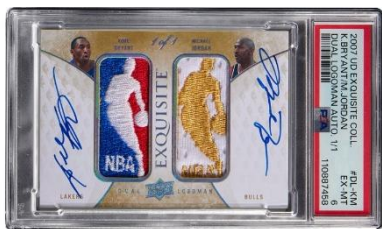
マイケル・ジョーダンとコービー・ブライアントの両名が サインした世界唯一の 1/1 カード

スポーツ部門は夏のオークションで好成績が数多く生み出されました。5 月には、 シカゴ・ブルズが初の 3 連覇を達成した 1992-93 年シーズンの 17 試合で実使用されたマイケル・ジョーダン着用ユニフォーム が、 262 万 3,000 ドル （約 3 億 9,000 万円）で落札されました。