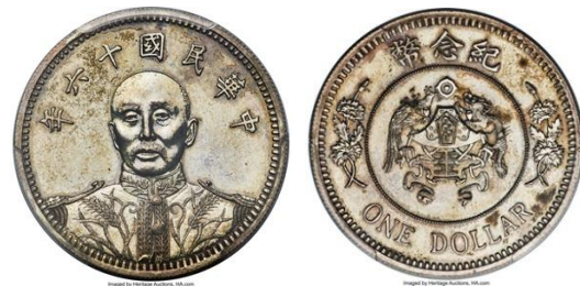
「白家コレクション（The Peh Collection）」より 1927 年 張作霖 試鑄ドル銀貨

また、紙幣オークションも 6,190 万ドル（約 97 億円）を売り上げ、貨幣部門全体として、2025 年も力強い成果を収めました。