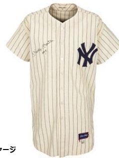
ミッキー・マントル着用・直筆サイン入り フォトマッチ済みのニューヨーク・ヤンkeesのジャージ

また、 1960 年のオールスターゲームを含む複数試合で使用されたミッキー・マントル着用、直筆サイン入り・フォトマッチ済みのニューヨーク・ヤンkeesのジャージ が、 524 万 6,000 ドル （約 7 億 9,000 万円）で落札され、スポーツファンから注目を集めました。 こうした数々の高額落札により、スポーツ部門は年間総売上 1 億 8,920 万ドル （約 284 億円）を記録し、 圧倒的な実績をもって一年を締めくくりました。