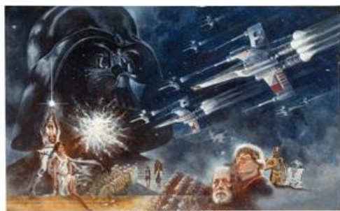
イラストレーターのトム・ユング氏が制作した 『スター・ウォーズ／新たなる希望（エピソード4）』（1977年）ポスター原画

加えて12月には、映画史において最も長く愛されてきたSF映画の一つ、『スター・ウォーズ／新たなる希望（エピソード4）』（1977年）のためにイラストレーターのトム・ユング氏が制作したポスター原画が、 約387万ドル（約5億8,000万円）で落札 されました。この結果、本作品は スター・ウォーズ関連メモラビアとして史上最高額 を記録するとともに、 映画ポスター作品としてもオークション史上最高額 となりました。映画関連アートが文化的に重要であるだけでなく、真の美術品として評価されつつあることを示す結果となりました。