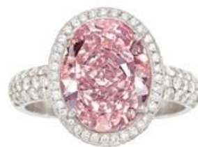
6.17 カラット ファンシー ピンク ダイヤモンド リング

ラグジュアリー部門では、9 月に過去最大規模となる ファイン・ジュエリーオークション を開催し、総売上 920 万ドル（約 14 億 4,950 万円）を記録しました。さらに 12 月には 6.17 カラットのファンシー ピンク ダイヤモンド リング が 218 万ドル（約 3 億 4,300 万円）で落札され、 同社史上最高額のジュエリー となりました。年間では、 ファインジュエリー＆時計部門 が総売上 4,840 万ドル（約 76 億 2,770 万円）を達成し、過去最高記録を更新しています。