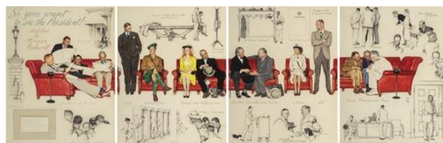
ノーマン・ロックウェル 《So You Want to See the President!》（1943 年）

アメリカ美術部門では、 40 年以上にわたりホワイトハウスに貸与展示され、歴代大統領や来訪者に親しまれてきたノーマン・ロックウェルの《So You Want to See the President!》（1943 年） が、 725 万ドル （約 10 億 9,000 万円）で落札されました。 本オークションは、同社史上最も成功したアメリカ美術オークションとなり、総売上は 1,476 万ドル （約 22 億 1,000 万円）に達しました。