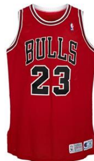
マイケル・ジョーダン着用ユニフォーム

続く 8 月には、 2007-08 年 アッパーデッキ「エクスクイジット・コレクション」デュアル・ロゴマン サイン入りカード が出品され、 マイケル・ジョーダンとコービー・ブライアントの両名がサインした世界唯一の 1/1 カード は、 1,293 万 2,000 ドル （約 20 億 3,750 万円）で落札され、 スポーツカードのオークション史上最高額を記録 しました。