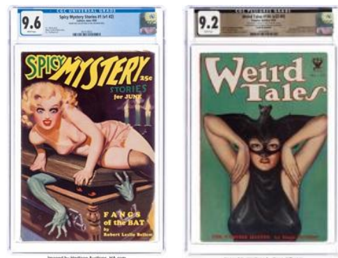
1935 年 6 月創刊号 『Spicy Mystery Stories』

12 月には、初開催となる Pulps Signature® オークション が実施され、総売上 184 万ドル（約 2 億 8,990 万円）を記録しました。コレクターのリチャード・メリ博士のコレクションを中心に構成された本オークションでは、1935 年 6 月創刊号『Spicy Mystery Stories』が 15 万 6,000 ドル（約 2,450 万円）で落札されたほか、「バット・ウーマン」表紙で知られる『Weird Tales』第 118 号が 10 万 5,000 ドル（約 1,650 万円）で落札され、見過ごされてきた分野に新たな市場価値を確立しました。