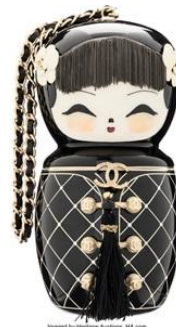
シャネル ミノディエール

また、2011年にヘリテージが業界に先駆けて立ち上げたラグジュアリー・アクセサリ部門も、 年間売上 1,290 万ドル（約 20 億 3,250 万円）と過去最高を更新 しました。5月には「 世界最高峰のシャネル・ハンドバッグ・コレクション 」が 81 万 1,000 ドル（約 1 億 2,778 万円）を記録 し、同日のオークション全体では、 1 日で 336 万ドル超（約 5 億 2,940 万円）の売上を達成 しました。本オークションには、人気の高いシャネルのミノディエール（落札額 5 万ドル／約 787 万円）や、ダイヤモンドを施したエルメス・ボロサス・クロコダイルのバーキン（落札額 11 万 2,500 ドル／約 1,770 万円）などが含まれていました。