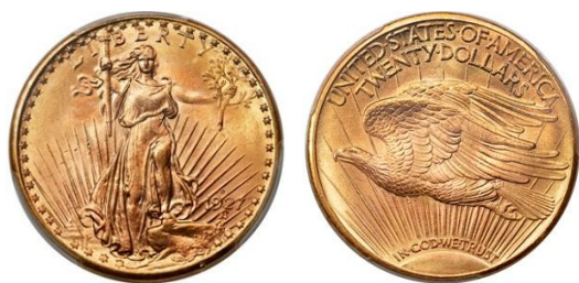
1927-セント・ゴードENS・ダブルイーグル金貨

1976 年に貨幣オークションハウスとして創業したヘリテージ・オークションズは、現在も同分野にて卓越した実績を誇ります。 2025 年の貨幣オークションの年間総売上は、4 億 7,000 万ドル超 （約 705 億円）に達しました。