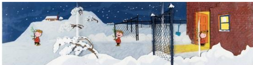
『チャーリー・ブラウンのクリスマス』のセル画

トレーディングカードゲーム（TCG）部門でも記録的な成果が続き、12 月のオークションは 総売上 528 万ドル（約 8 億 3,240 万円） と、 TCG オークション史上最高額を記録 しました。中でも、 PSA により鑑定された世界唯一のポケモン「ベースセット プレリリース ライチュウ」カードは、55 万ドル（約 8,660 万円）で落札され、英語版ポケモンカードとして、世界最高額の記録を達成 しました。