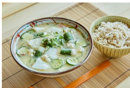
浜の月としそかをり巻の冷や汁