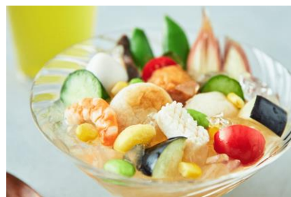
冷やしおでんの夏野菜カクテル