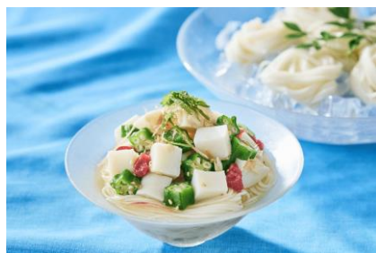
かまぼこと梅オクラのそうめん

鈴廣かまぼこの公式サイトでは、暑い季節でもさっぱり楽しめる、夏にぴったりなアレンジレシピを公開中です。日々の献立やおもてなしメニューとしてもぜひご利用ください。