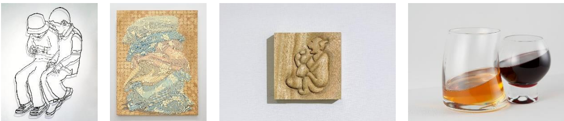
(左から) Shop No.5 今井みのり, No.6 アレックス・ダッジ, No.7 高山瑞, No.8 玉山拓郎の作品イメージ(参考画像含む)

中華×スペイン料理の人気レストラン TexturA には、同店と 4 回目のコラボレーションとなるアーティスト玉山拓郎が、グラスケース内に小作品の新作を発表します。 https://www.marunouchi.com/tenants/10121/