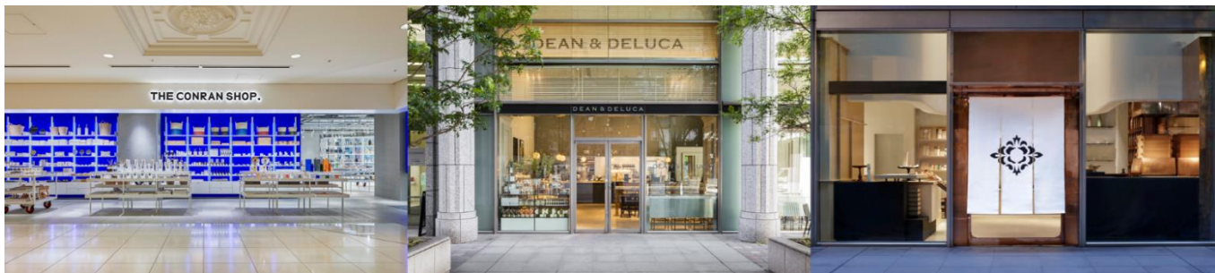
(左から) ザ・コンランショップ 丸の内店、DEAN & DELUCA カフェ 丸の内、HIGASHIYA man 丸の内

今回は、キャラメル専門店「NUMBER SUGAR」や高性能でサステナブルなシューズブランド「Allbirds」など前回参加店舗に加え、新たに「ザ・コンランショップ」「DEAN & DELUCA」「HIGASHIYA man」の3店舗が加わり、全8店舗で開催。各店舗のショーウィンドウに、お店のイメージに合わせたアート作品が並びます。