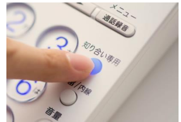
【知り合い専用ボタン】

知り合い専用機能の設定時は、電話帳登録のない相手先には「申し訳ありませんが、こちらの都合により電話をおつなぎすることができません」というメッセージで応対し自動的に電話を切るため ※2 、電話帳に登録している“知り合い”からの電話のみに安心して出ることができます。