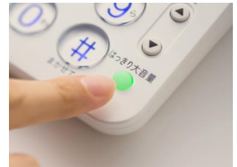
【はっきり大音量ボタン】

補聴器や集音器 ※3 といった聞こえサポート商品のノウハウを活かし、聞き取りづらさを改善します。通話中に「はっきり大音量」ボタンを押していただだけで、受話器からの相手の声が大きくなり、聞き取りにくくなった高い音を強調するので、会話時の相手の声が聞き取りやすくなります。