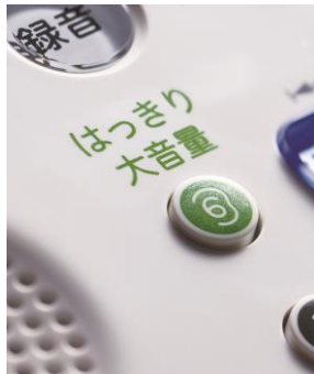
【「はっきり大音量」ボタン】

通話中に「はっきり大音量」ボタンを押すと、受話器からの相手の声が大きくなるとともに、高い音を強調するので、会話時の相手の声が聞き取りやすくなります。