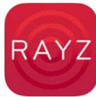
【専用アプリケーション 「Pioneer Rayz」のアイコン】