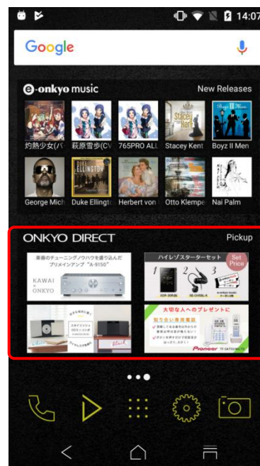
【“ピックアップ”ウィジェットをホーム画面に追加したイメージ】