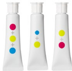
なまえのないえのぐ 【2012年グランプリ受賞】