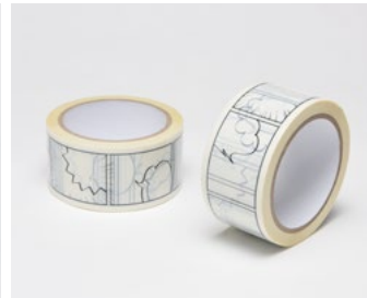
マンガムテープ 【2016年優秀賞受賞】