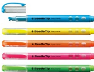
ビートルティップ 【2007年優秀賞受賞】