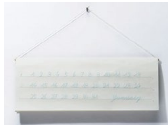
儂く、美しく 【2015年優秀賞受賞】