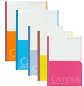
パラクルノ (Paracuruno) 【2002年優秀賞受賞】