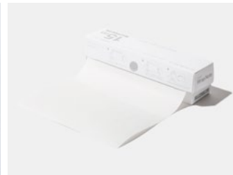
ペーパーラップノート 【2011年ココヨ賞受賞】