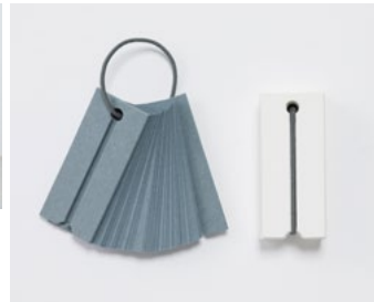
すっきりとした単語帳 【2015年グランプリ受賞】