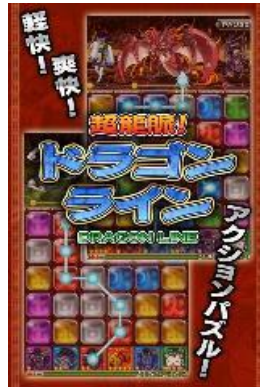
超龍脈! ドラゴンライン (アクションパズル)