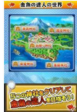
金魚の達人 (アクション)