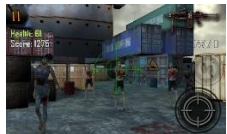
▲「DEAD SHOT ZOMBIES」