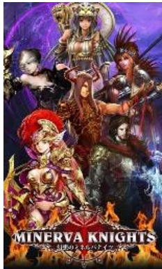
幻想のミネルバナイツ (カードバトル RPG)