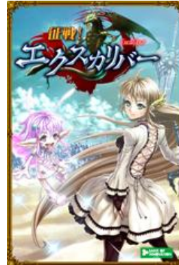
征戦! エクスカリバー (チームバトル RPG)