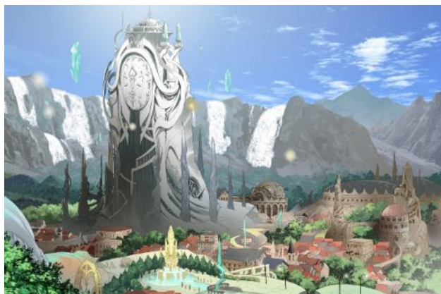
魔術師たちが多く住む魔法の国 ルート