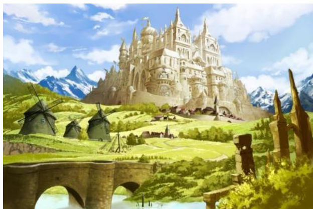
中央国家で最大の勢力を誇る騎士の国 グラス

ゲームの主な舞台となるのは、「シード」の中央に存在するひとときわ大きな大陸——中央大陸。そこにはいくつかの国家が存在しますが、そのうち4つの国家が大きな勢力を誇っています。