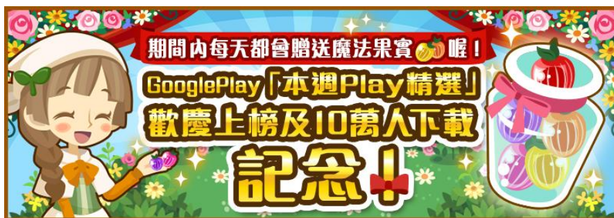
▲記念キャンペーンバナー

GMO ゲームセンター株式会社の韓国法人 GMO GameCenter Korea, inc. (以下、Gゲーコリア) と株式会社アイトレンタ (以下、アイトレンタ) が共同で企画・開発し、台湾・香港向けに配信中のスマートフォン向け箱庭育成シミュレーションゲーム『箱庭物語～往動物小島の信』は、3月27日に台湾・香港の Google Play の「本週 Play 精選 (今週のおすすめ)」に選定されました。これを記念して、4月6日まで、繁体字版でゲーム内の通貨を毎日配布するキャンペーンを実施いたします。